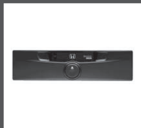
18 > Kassettenabspielgerät