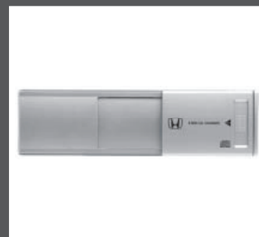
20 > 8-CD-Wechsler