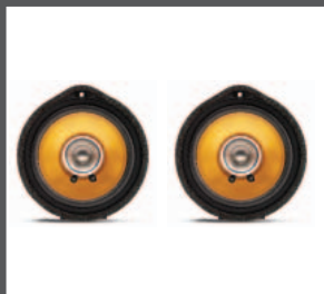
25 > Dual Cone-Lautsprechersatz (Upgrade)