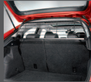
55 > Hunde-/ Frachtgitter