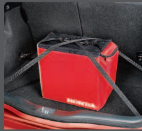
49 > Kofferraumspanngurte