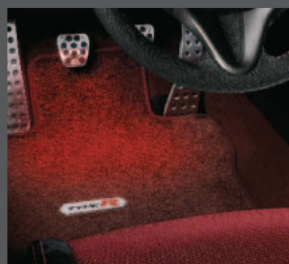
31 > Rote Innenbeleuchtung