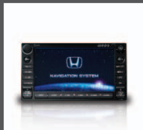
22 > DVD Navigation System