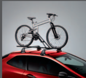
45 > Fahrradhalter Classic