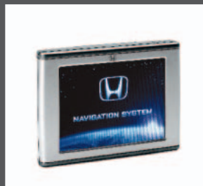
23 > Portables Navigation System