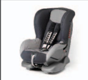
36 > Kindersitz Gruppe 1+ Lord Plus