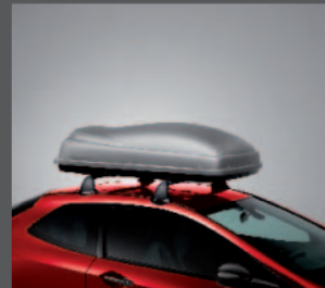
43 > Top Box - 350 Liter