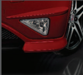
9 > Nebelscheinwerfer vorne