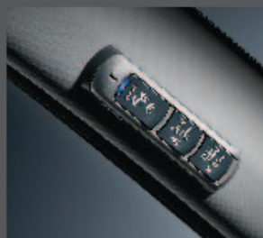
30 > Bluetooth®-Freisprechsystem (Einbausatz)