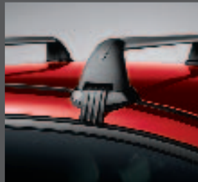
41 > Zusatzkit - Grundträger