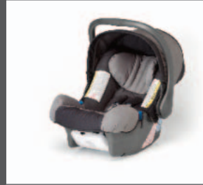
34 > Kindersitz Gruppe 0+ Baby-Safe