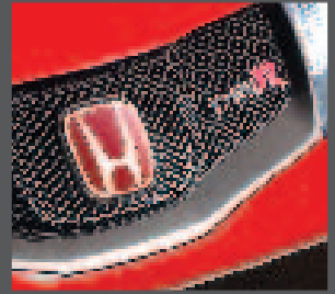
3 > Emblem Type R