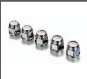
15 > Radmuttern