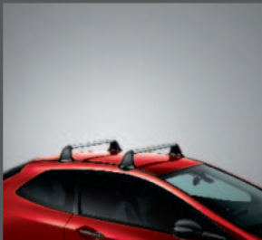
40 > Grundträger