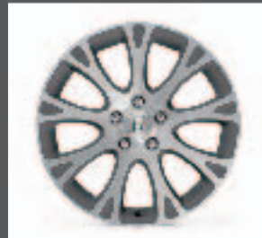
13 > 18"-Leichtmetallfelge "Altimo"