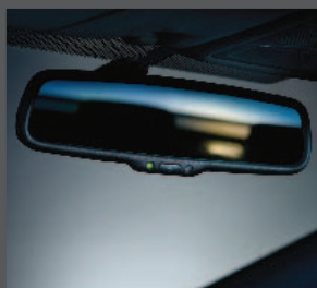
29 > Innenspiegel - abblendend (Einbausatz)