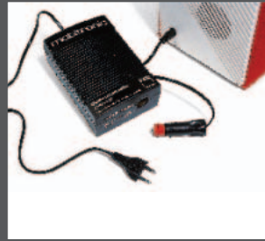
57 > Kühltasche-Netzadapter