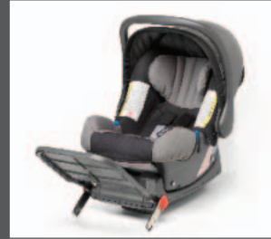
35 > Kindersitz Gruppe 0+ Baby-Safe Iso-Fix