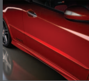
6 > Seiten-/ Türschutzleisten