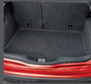
51 > Kofferraumteppich