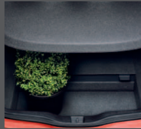
54 > Kofferraumabdeckung