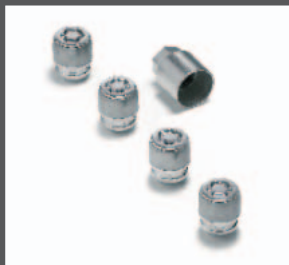
16 > Diebstahlfelgenschloss