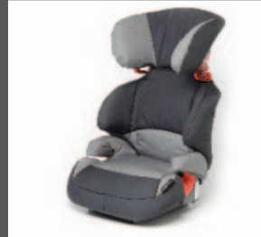
38 > Kindersitz Gruppe 2&3