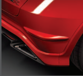
5 > Stoßstangeschutzleisten hinten