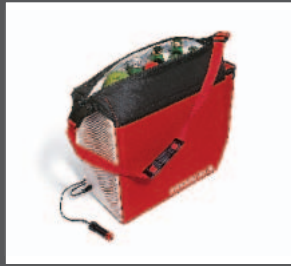
56 > Honda Kühltasche