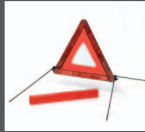
58 > Pannendreieck

Weitere Informationen erhalten Sie bei Ihrem örtlichen Honda-Händler.