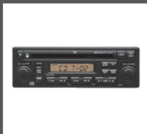
17 > CD-Radio-Tuner Kit