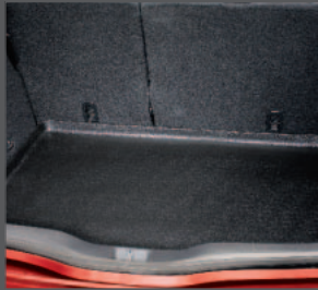
52 > Kofferraumwanne