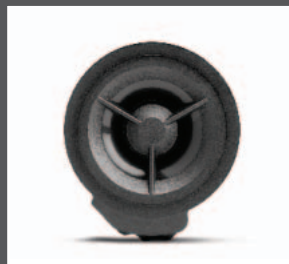
27 > Hochtönersatz