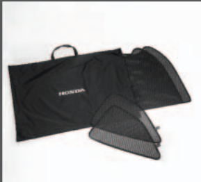
39 > Sonnenschutzblenden