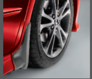
7 > Kotschutzlappen vorne