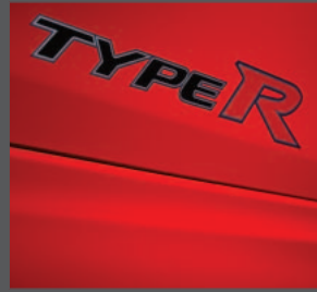
3 > Aufkleber Type R