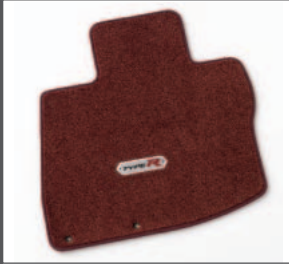
32 > Teppichsatz Type R - Elegance