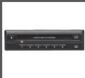
19 > 1-DIN-6-CD-Abspielgerät