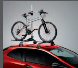
47 > Fahrradlift