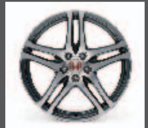
14 > 19"-Leichtmetallfelge "Rage" (nur für Type R)