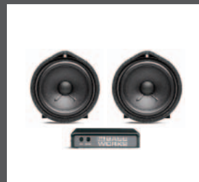
24 > Bass Sound System