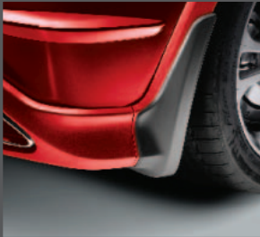
8 > Kotschutzlappen hinten