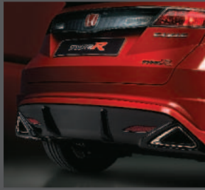
2 > Heckschürze Type R