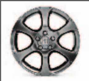
11 > 18"-Leichtmetallfelge "Storm"