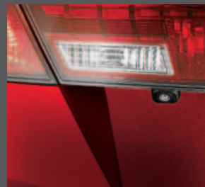
28 > Rückfahrkamera