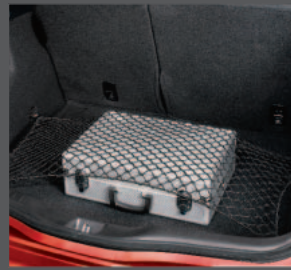
50 > Gepäcknetz