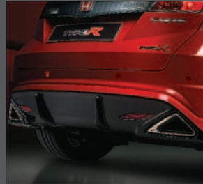
10 > Einparkhilfe hinten