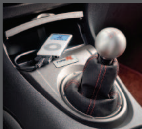
21 > iPOD Anschluss Kit