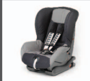
37 > Kindersitz Gruppe 1+ Duo Plus Iso-Fix