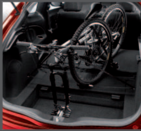
48 > Innerer Veloträger