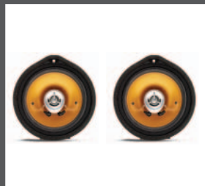
26 > Koaxial-Lautsprechersatz (Upgrade)