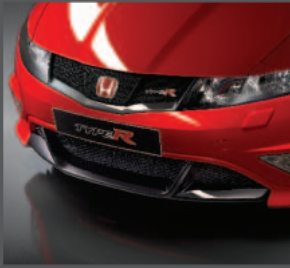
1 > Frontschürze Type R