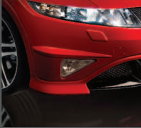
4 > Stoßstangeschutzleisten vorne