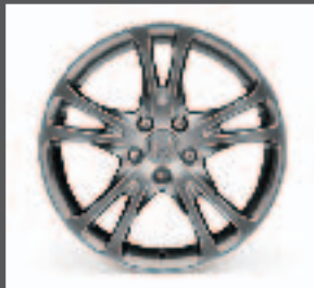
12 > 18"-Leichtmetallfelge "Blade"