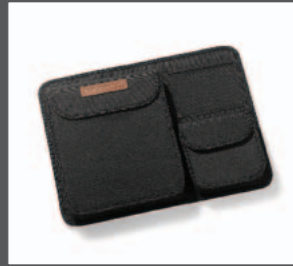
53 > Kofferraum-Tasche