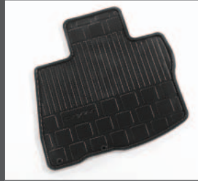
33 > Gummifussmattensatz