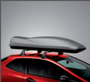
44 > Ski Box - 320 Liter